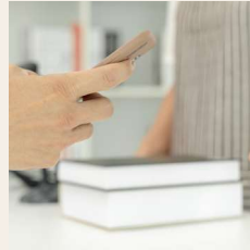
専用発券機で発券 混雑回避できるから安心！